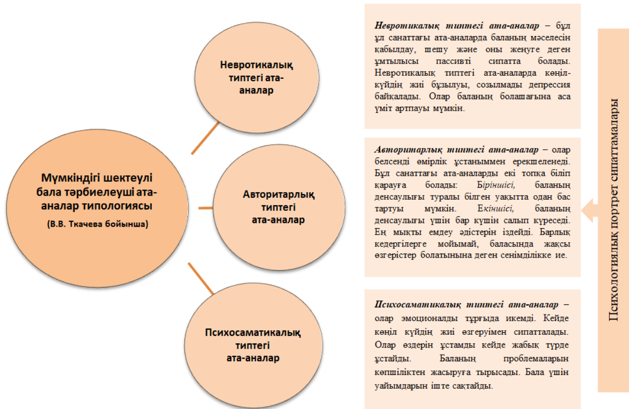
1-сурет. Мүмкіндігі шектеулі бала тәрбиелеп отырған ата-аналар типологиясының психологиялық портреттері

Осы аталған әр кезеңде ата-аналар мен отбасы мүшелері белгілі деңгейде жауапкершілікті сезінеді, қолдау көрсетеді [Селигман М., Дарлинг Р.Б., 2018].