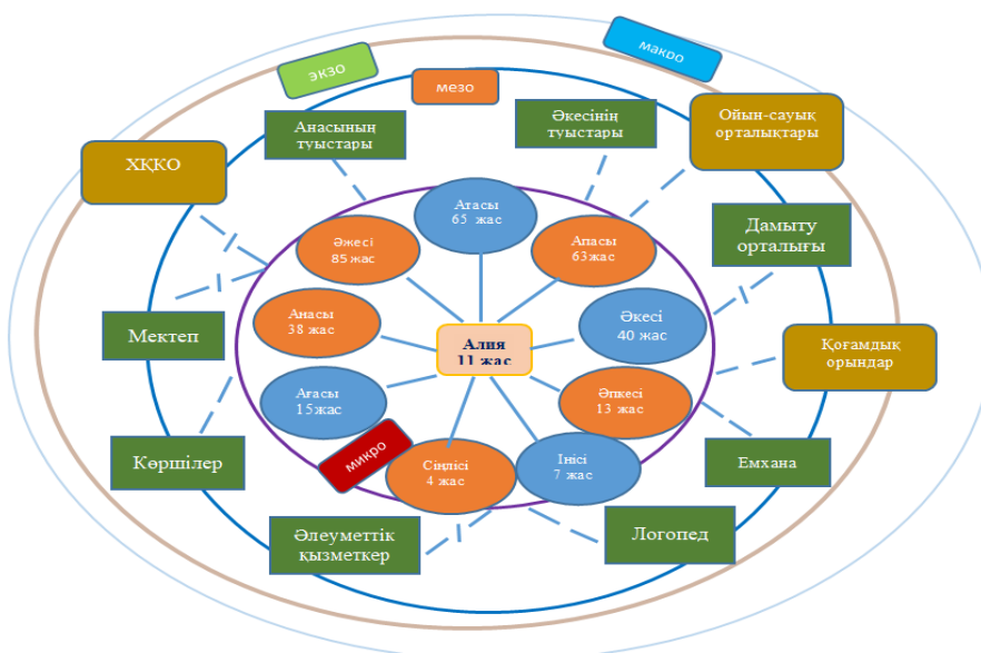
2-сурет. Алияға толтырылған «Экокарта»